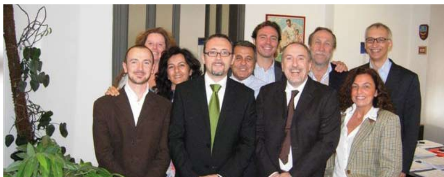
Gruppo di lavoro della filiale Banca Agrileasing di Torino

Le nostre filiali sono a disposizione per qualsiasi chiarimento.