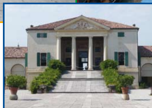
Treviso - Ville Venete - 19 giugno 2009