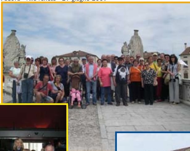
Padova - Ville Venete - 21 giugno 2009