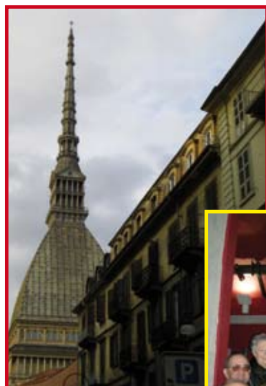
Torino - Museo del Cinema 18 aprile 2009