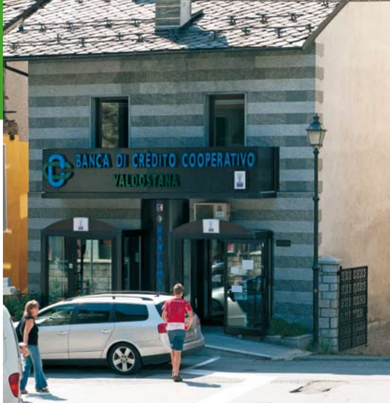
FILIALE DI NUS

P.zza Don Carlo Boschi, 4 Tel. 0125 920 980