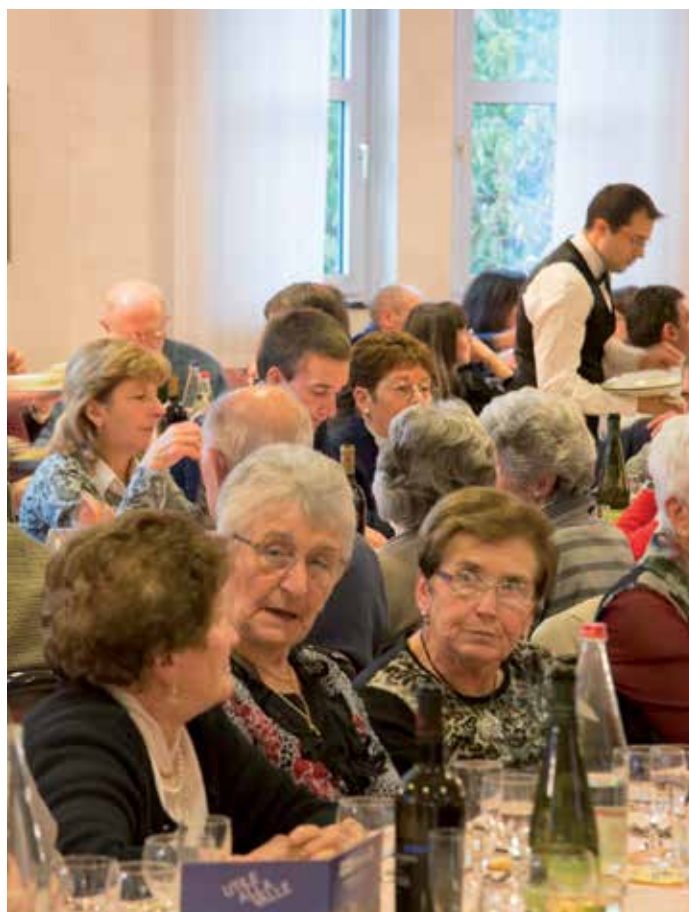
Étoile du Nord - Sarre