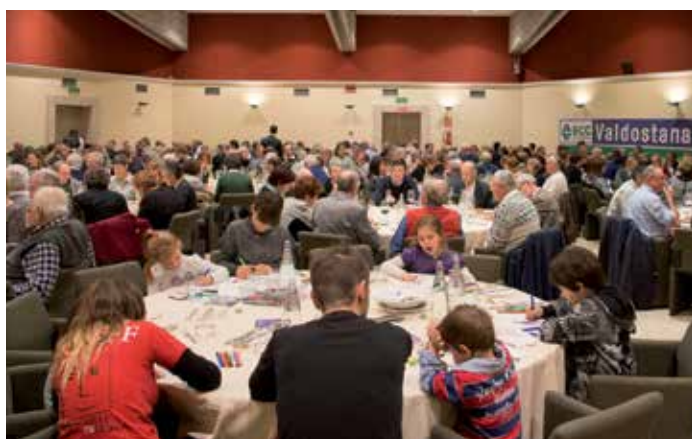
Hostellerie du Cheval Blanc - Aosta