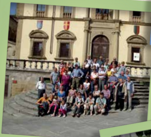
Toscana 9-12 ottobre