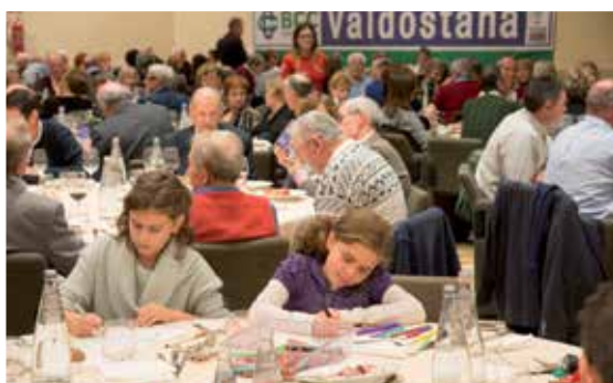
Hostellerie du Cheval Blanc - Aosta