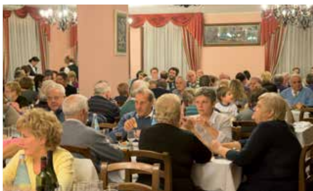
Hotel Napoléon - Montjovet