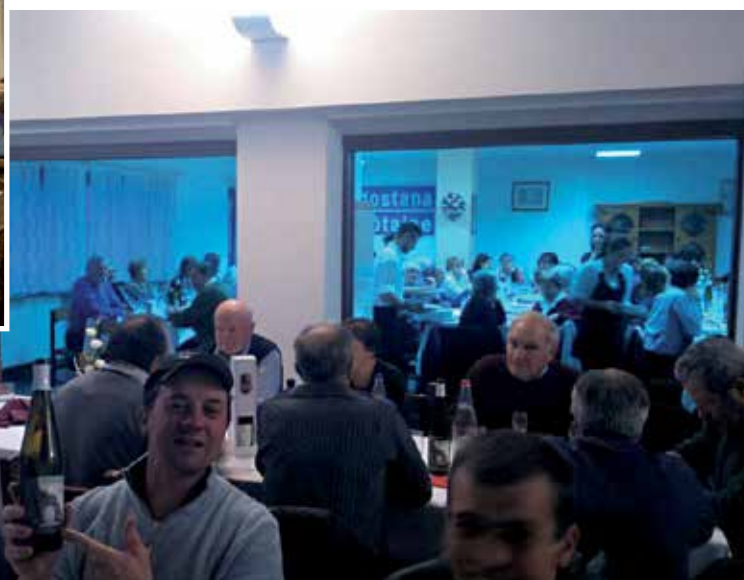
Caves Coopératives - Donnas