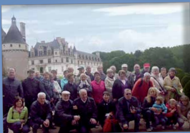
Castelli della Loira 23-27 aprile