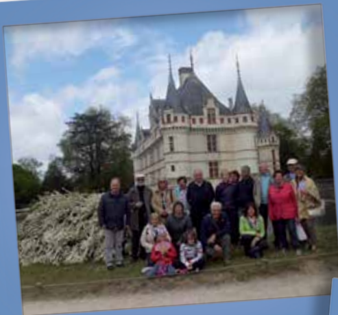
Castelli della Loira 23-27 aprile