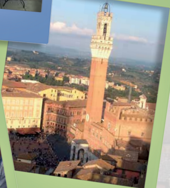
Toscana 9-12 ottobre

Il Programma Soci 2015 è in corso di definizione. A partire dal mese di gennaio i programmi completi e dettagliati saranno reperibili presso le nostre filiali, ove sarà possibile prenotarsi, l'Ufficio soci e il sito della banca; non vi saranno pertanto ulteriori comunicazioni indirizzate direttamente ai Soci relativamente alle iniziative a loro rivolte.