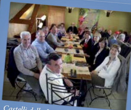
Castelli della Loira 23-27 aprile