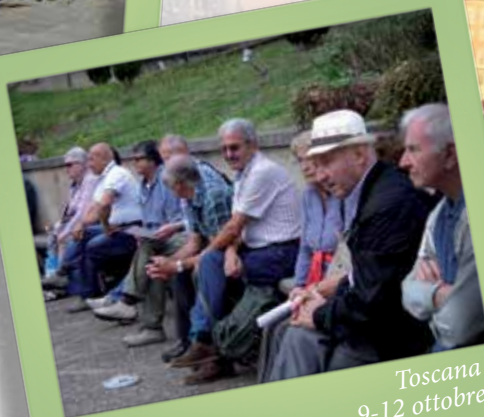
Toscana 9-12 ottobre