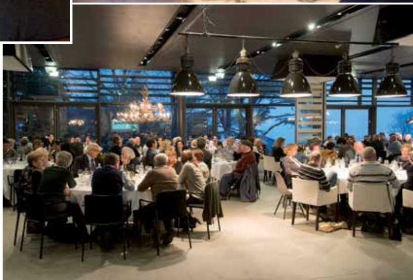
Parc Hotel Billia - Saint-Vincent